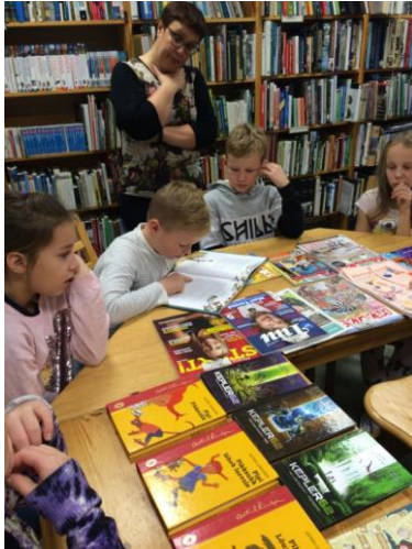
Joonis 1. Raamatukogutund (Tikk, 2017)